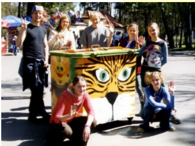
Un šādus konteinerus mēs atstājam aiz sevis mežos un citur...