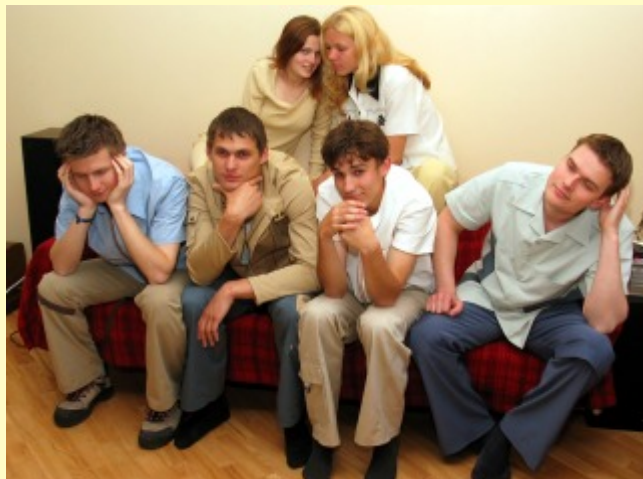
Latvijas Policijas akadēmijas studentu muzikālā grupa "Mazā sudraba karotīte", kuras 2002. gada "Projekta Pēdas" konkursā ieguva publikas atzinības balvu.

"Kādā rudenīgā dienā draugu pulkā devāmies meža biežokni sēnot... Briņot pa meža takām, uzgājām kādu vecu onkulīti, kurš ar savu veco žigulīti bija iestrēdzis dubļos un netika ne uz priekšu, ne atpakaļ. Viens, divi dabūjām onkulīti ārā ar visu autiņu. Onkulītis lejojot priekā asaras iespieda plaukstā mazu sudraba karotiņu sacīdams: "Še jums draugi karotīte liekat to lietā lai cilvēkiem prieks." Atvadoties viņš vēl klusi piebilda: "Tā viss nav parasta karotīte... Tā ir mazā sudraba karotīte"